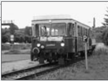
T 06 bei seiner Ankunft in Amstetten 2002