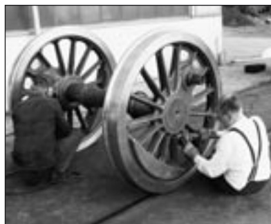
Diese „Gelegenheit“ wurde für eine Neulackierung der Radsätze und des Fahrwerks genutzt.

Da die Radreifen der 50 3539 am unteren Grenzmaß angelangt waren, war eine dauerhafte Reparatur nur mit einer