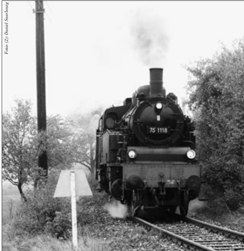
An der Trapeztafel des Bahnhofes Gussenstadt kommt uns 75 1118 am 10. Oktober 2004 entgegen