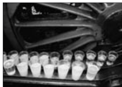
Die Truppe des Speisewagens hatte flugs das Triebgestänge des Lokjubilars zur Bar umfunktioniert und alle Gäste durften sich bedienen.

In Offenburg begann der fahrtechnische Höhepunkt der Reise für die etwa 300 Gäste. Eine Parallelfahrt in den Schwarzwald hinauf nach Triberg. Der Zug wurde geteilt und die 01 509 wartete schon, um einen Teil des Zuges zu übernehmen. Zwischen Hornberg und Triberg war die Begeisterung nicht mehr zu toppen, wenn die schweren Maschinen mit ihren Zügen fast auf Armeslänge nebeneinander den Schwarzwald hinaufstampften, ehe ab Triberg der wiedervereinigte Zug dann über Villingen-Schwenningen und Rottweil über die Gäubahn in der Abendsonne Stuttgart entgegenfuhr.