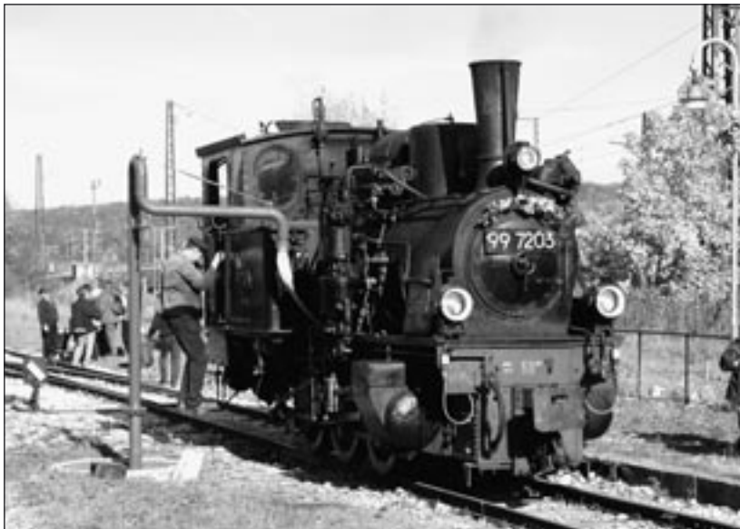
Ein neuer Anziehungspunkt im Schmalspur-Teil des Bahnhofs Amstetten ist der Wasserkran.