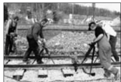
Die Kollegen aus Ettlingen unterstützten einen Tag an den elektrischen Handstopfern.

Einen wahren Endspurt bedeutete dann das Richten, Schottern und Stopfen des Baugleises und der Weiche: Es zog sich schließlich bis in die letzten Apriltage hin.