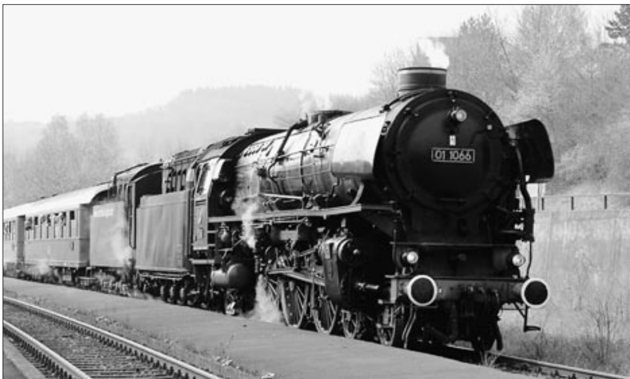
In ganz Deutschland und auch im Ausland waren die Loks und Wagen des Historischen Dampfschnellzuges wieder unterwegs.

Das ist auch dringend notwendig, denn der Unterhalt des Materials ist nach wie vor kostspielig.