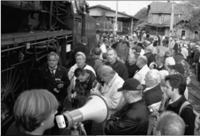
Jubiläumsansprache in Ettlingen Stadt