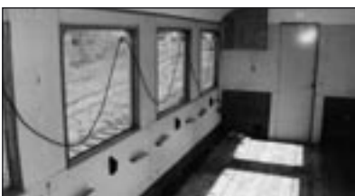
B20, hier noch ohne Inneneinrichtung, wird unseren Dampfzug bald um 48 Plätze verstärken.

Die innere Kesseluntersuchung an unserer Betriebslok im Winter 2003/2004 ergab keine Beanstandung, jedoch wird bei der nächsten Revision 2006 ein neuer Rohrsatz eingezogen werden müssen. Zur Zeit ist die Lok für die anstehende Fahrwerksuntersuchung ausgeacht. Erste Sichtprüfungen an den Lagern zeigen einen sehr guten Zustand, so dass große Arbeiten hier nicht zu erwarten sind.