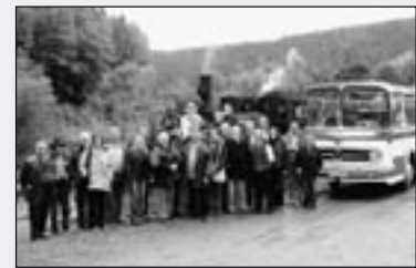
„Historisch korrekte“ Pflege der Gemeinschaft: Ausflug der Aktiven mit Bus und Bahn

Mit einem historischen Omnibus machten sich Familienangehörige und Aktive vom Alb-Bähnle auf den Weg nach Neustadt/W zu den Kollegen vom Kuckucksbähnle. Kernpunkte des Programmes waren die Besichtigung des Museums in Neustadt sowie eine Fahrt mit dem Dampfzug im herbstlich bunten Elmsteiner Tal. Solche Ausflüge zu anderen Bahnen sind für die Aktiven oft die Einzige Gelegenheit, sich einmal aus der Fahrgastperspektive mit dem Thema Museumsbahn auseinanderzusetzen.